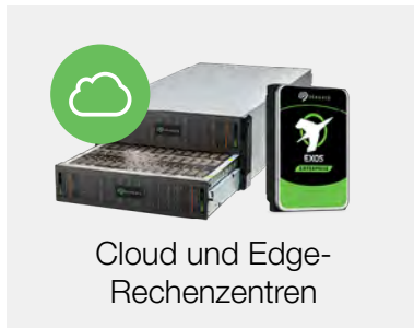
Cloud und Edge-Rechenzentren